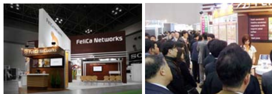
昨年のIC CARD WORLD 2009 フェリカネットワークスブース模様

会期 : 2010年3月9日(火)~12日(金) 開催時間 : 10:00~17:00 (最終日のみ16:30終了) 場所 : 東京国際展示場「東京ビックサイト」東2ホール ブースNo. : IC2319 URL : http://www.iccard.jp/