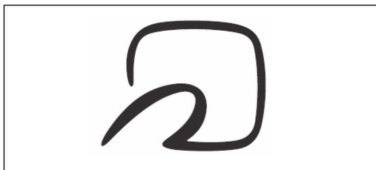
「FeliCa プラットフォームマーク」

FeliCa 技術を活用したサービスに対するユーザー認知を高め、プラットフォームの普及を促すためのビジュアルアイデンティティとして「FeliCa プラットフォームマーク」を提唱します。フェリカネットワークスからのライセンスに基づき、サービス事業者は本マークをカード券面、端末、広告媒体などに表示することが可能です。